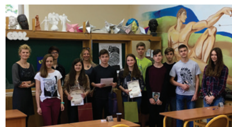
Najlepsi angliści z dyplomami.