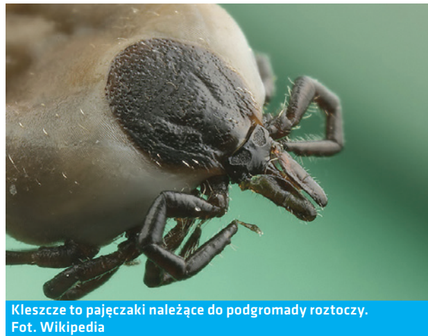
Kleszcze to pajęczaki należące do podgromady roztoczy.

wiele miesięcy. Następnie należy obejrzeć dokładnie również zakryte części ciała, w tym również przejrzeć włosy u dzieci,