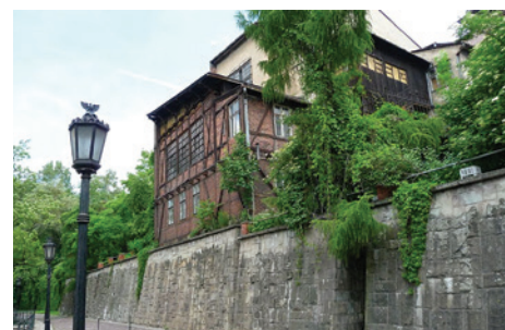
Mury oporowe przy ulicy Przykopa.