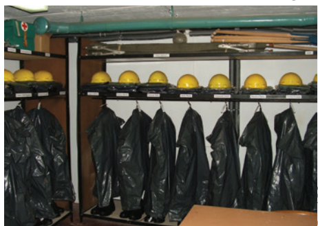
Obecnie schron służy jako magazyn sprzętu obrony cywilnej.