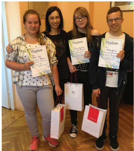
Cieszyniacy laureaci konkursu.

Miło nam poinformować, że został rozstrzygnięty konkurs fotograficzny Cieszyn – Puck – współpraca szkół , w którym wzięli udział uczniowie Publicznego Gimnazjum im. Morskiego Dywizjonu Lotniczego w Pucku i Gimnazjum nr 3 z Oddziałami Integracyjnymi w Cieszynie.