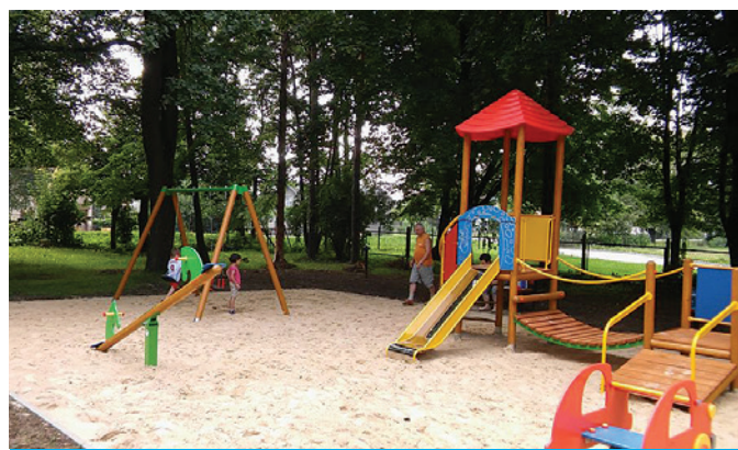
Plac zabaw przy Szkole Podstawowej nr 6.

Karuzela, piaskownica, huśtawki, sprężynowiec, zestaw zabawowy wisus, domek oraz elementy małej architektury takie jak: