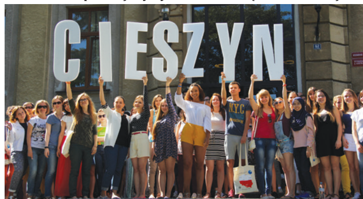
Uczestnicy XXVI Letniej Szkoły Języka, Literatury i Kultury Polskiej czują się w Cieszynie znakomicie.