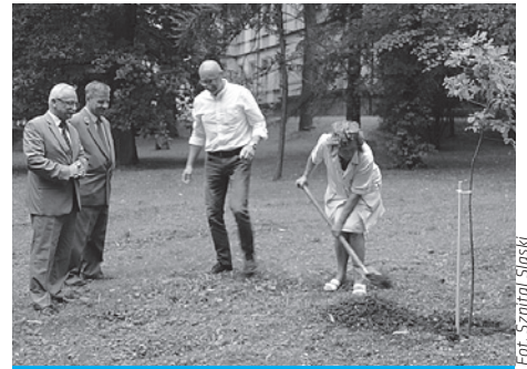
Dąb został posadzony w szpitalnym parku.

28 lipca – w ramach jubileuszu 25-lecia Fundacji Zdrowia Śląska Cieszyńskiego – w zabytkowym parku Szpitala Śląskiego w Cieszynie został posadzony dąb wyhodowany z żołądki dębu Cysters , najstarszego drzewa rosnącego na terenie dawnego opactwa cysterskiego w Rudach.